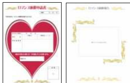
ロマンス休暇申請書