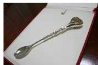
世界で唯一本、 あ〜ん専用スプーン