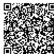
デコメサイト「デココレ」 QRコード

他にも多数のロマンティックデコメと企画を配信予定! 「デコメ」は、株式会社エヌ・ティ・ティ・ドコモの登録商標または商標です。 問い合わせ先: 株式会社アイフリーク https://www.i-freek.co.jp/inquiry/form.php