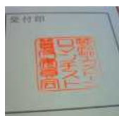
ロマンチスト普及委員会による申請承認印