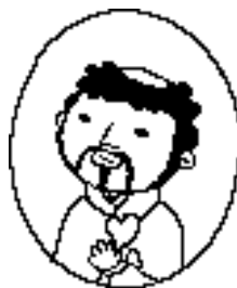
ロマンス宣教師 ざびえるさん